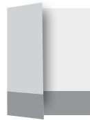
pasek na skrzydle okładki i pasek na I okładce