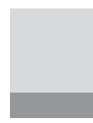
pasek w spisie treści