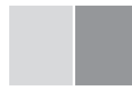
prawa strona przy krzyżówkach