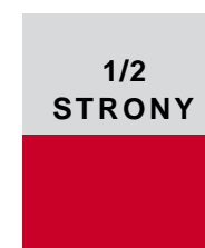
184 x 127 mm (w ramce) 205 x 140 mm + spad (pełny)