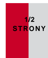
90 x 270,7 mm (w ramce) 101x 295 mm + spad (pełny)