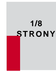
43 x 127,8 mm (w ramce) 54 x 141 mm + spad (pełny)