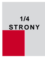
90 x 127,8 mm (w ramce) 101 x 141 mm + spad (pełny)