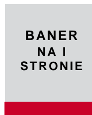
205 x 35 mm + spad