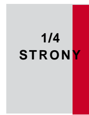
43 x 270,7 mm (w ramce) 54 x 295 mm + spad (pełny)