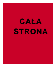
184 x 270,7 mm (w ramce) 205 x 295 mm + spad (pełny)