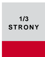
184 x 80 mm (w ramce) 205 x 93 mm + spad (pełny)